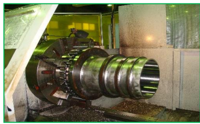
長さは2000mm程度まで対応