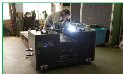
手溶接による製缶加工も