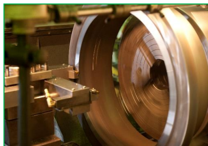
φ850までの加工に対応