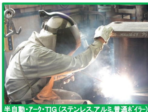
半自動・アーク・TIG (ステンレス, アルミ, 普通ボイラー)