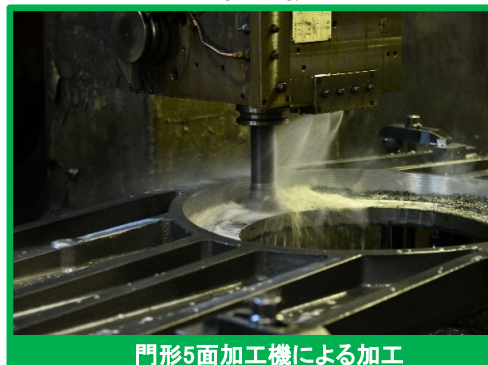
門形5面加工機による加工