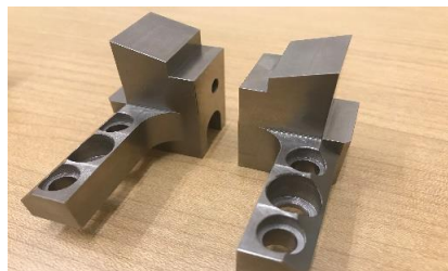
①金型クランプ部品