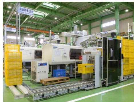
グループ企業で試作量産が可能です。