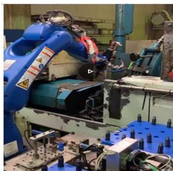
円筒研削盤ローディング装置